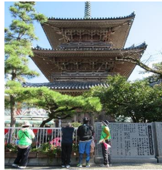
ボランティアガイドの様子