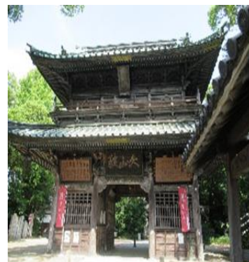
ボランティアガイドの様子

昔、このあたりは紙をつくる会社や紙を売る会社が多かった・・・ そんな紙に関する歴史や、市内有数のパワースポットである三島神社 で三島の歴史・逸話を、ガイドのお話を聞きながらゆっくりまち歩きして みませんか？道中の商店街では、三島を代表するお菓子やお土産 などのお買い物もお楽しみいただけます。昼食はルミエールで季節 にあった地元の品を使った料理をいただきます。 (協力：ルミエール・たつの屋・丸亀屋・(株)大倉稔商店)