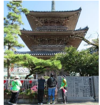
ボランティアガイドの様子

昔、このあたりは紙をつくる会社や紙を売る会社が多かった・・・ そんな紙に関する歴史や、市内有数のパワースポットである三島神社 で三島の歴史・逸話を、ガイドのお話を聞きながらゆっくりまち歩きして みませんか？道中の商店街では、三島を代表するお菓子やお土産 などのお買い物もお楽しみいただけます。昼食はルミエールで季節 にあった地元の品を使った料理をいただきます。